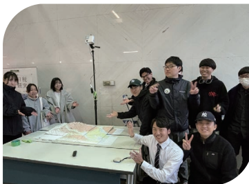
プロジェクションマッピングの展示