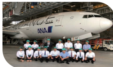
夏季企業研修 (ANA 羽田整備工場:2019年度)

最後は、公共交通の住民参加とソーシャルキャピタルの関係に関わる研究です。先に述べましたように条件不利地域の公共交通は苦しい経営を余儀なくされていますが、そのような地域の一部では住民が公共交通の企画・運営に参加する住民参加型の公共交通の運行が開始されています。一方、このような住民の取り組みの原動力になるものとは何か。ここでは、ソーシャルキャピタルの存在に焦点をあて、ソーシャルキャピタルの醸成が公共交通の住民参加に結びつくのか否かについて理論的・実証的に明らかにすることを目的に研究を行っています。