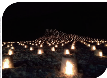
かだる雪まつり（教員の研究&実践活動）