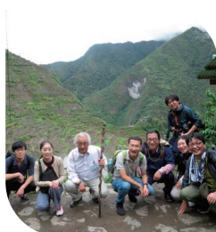
イフガオ棚田の前で

なお、2025年度の2年次基礎演習では、「本との偶然性出会い」をテーマに、グループワークを通じて学びを深めています。