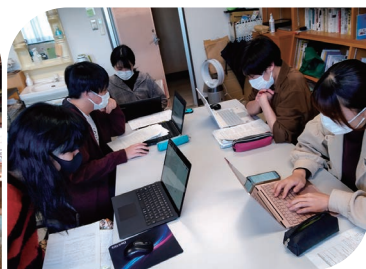
グループ研究論文執筆（ゼミナール活動）