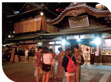
道後温泉調査（ゼミナール活動）

日本では最近、観光まちづくりがさまざまな地域で進められています。このま ちづくりには必ずと言って良いほど、リーダーの存在があります。彼らはどのように 観光まちづくりのリーダーとなったのか、彼らが発揮するリーダーシップとはどのよ うなものか、それはどのような成果をあげるのか、にとっても興味があります。これ まではリーダーの視点から研究を進めてきましたが、近年はフォロワー、すなわ ちリーダーシップの影響を受ける人々の視点から「観光まちづくりにおけるリーダ ーシップ」を研究しています。また、リーダー以外が発揮するリーダーシップについ ても研究していきたいと考えています。