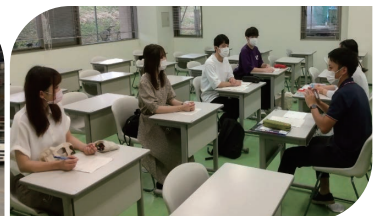
就職活動体験報告会 (2020年度)