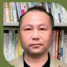
田中 宏和 研究室