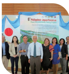
フィリピン共和国国立イフガオ大学